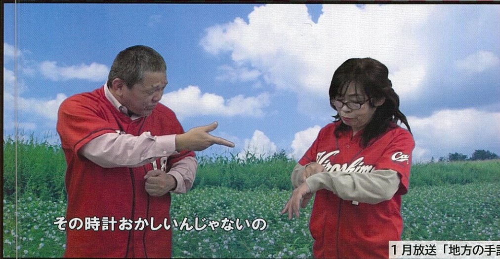
その時計おかしいんじゃないの