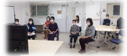
手話サロンの様子