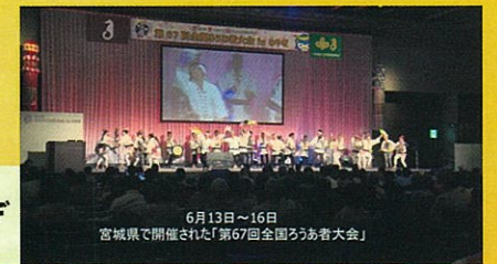
第67回全国ろうあ者大会 in みやぎ