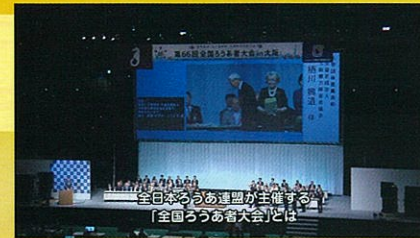
第66回全国ろうあ者大会 in 大阪

「カシマス・ド・スル大会ダイジェスト」と 「過去のろうあ者大会(大阪大会&宮城大会)を お届けします!