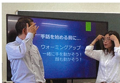
講師ペアによる楽しいコント！