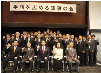
参議院議員会館で記念撮影

当日は、手話を広める知事の会会長の平井伸治鳥取県知事（以下、平井会長）、全国手話言語市区長会事務局長の泉房穂明石市長（以下、泉手話市長会事務局長）をはじめ国会議員、行政関係者、聴覚障害当事者、手話関係者等を含め約250名が参加しました。