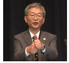
三重県 稲垣清文副知事