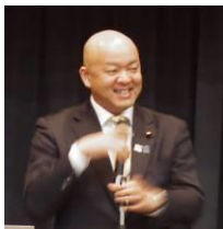
堀井学 外務大臣政務官