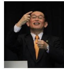
泉手話市長会事務局長