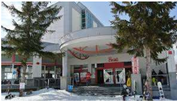
レストラン「ハイジ」